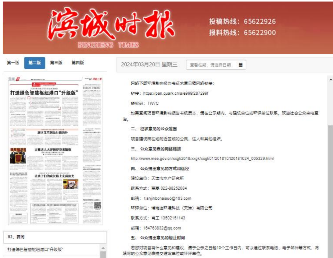
图 3.2-2 报纸公示第一次（2024年3月20日）

除采用网站公示外，本次公众参与也采用了滨城时报进行公开的方式。征求调查的范围主要围绕全市市民展开。在第二次公示期间，共计登报进行两次，分别为2024年3月20日和2024年3月21日，报纸截图见下图所示。