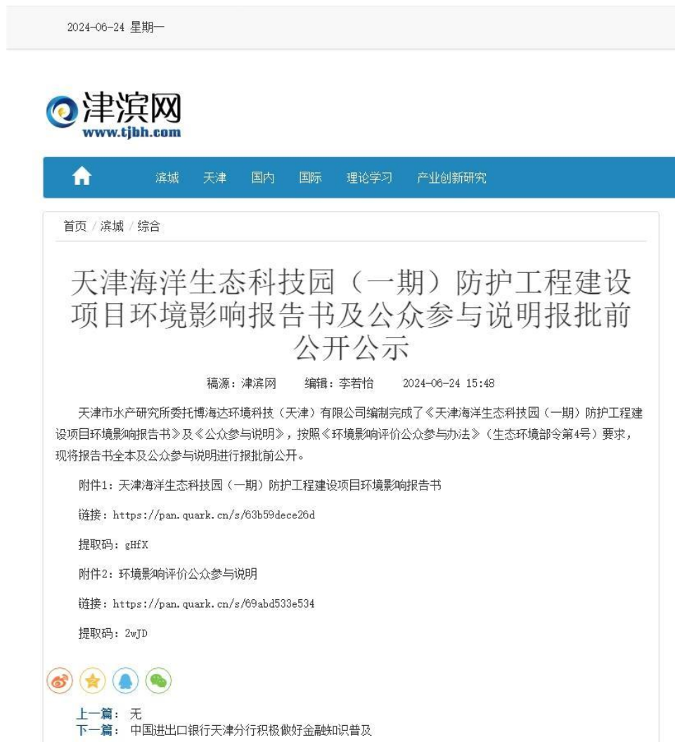
图 6.2-1 报批前信息公开截图

http://www.tjbh.com/c/2024-06-24/1336071.shtml ，公示截图见下图所示。