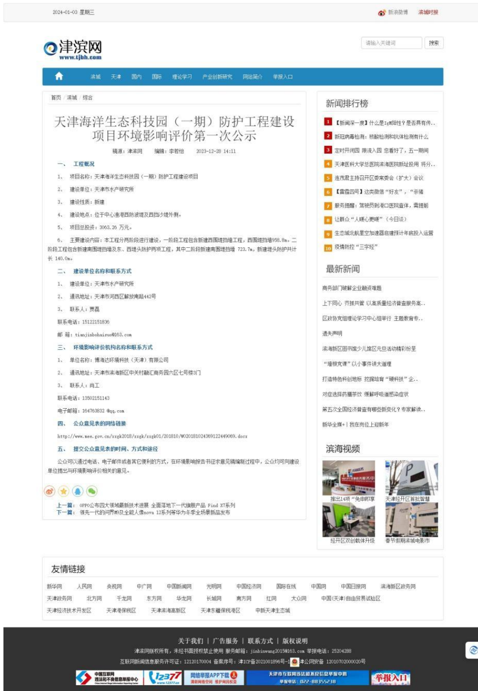
图 2.2-1 项目第一次公示信息内容截图