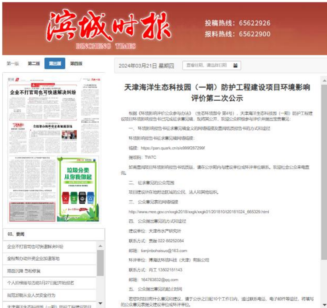
图 3.2-3 报纸公示第二次 (2024 年 3 月 21 日)