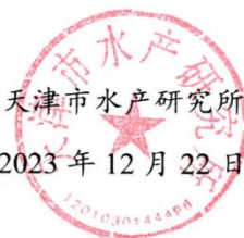
图 2.1-1 项目委托书