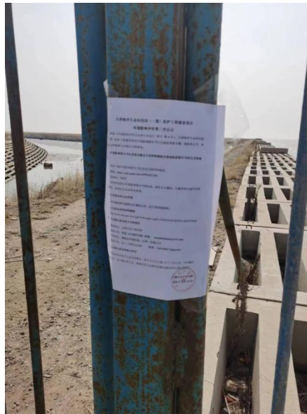
图 3.2-5 中心渔港区域现场贴图