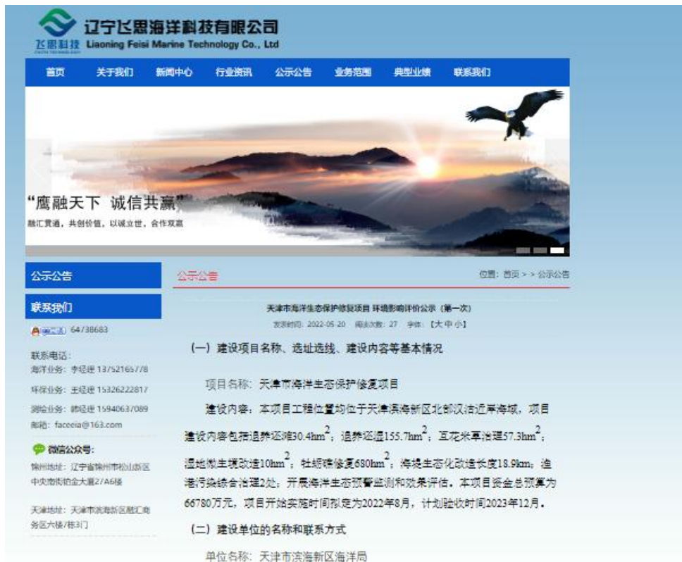
图 2.2-1 项目第一次公示信息内容截图