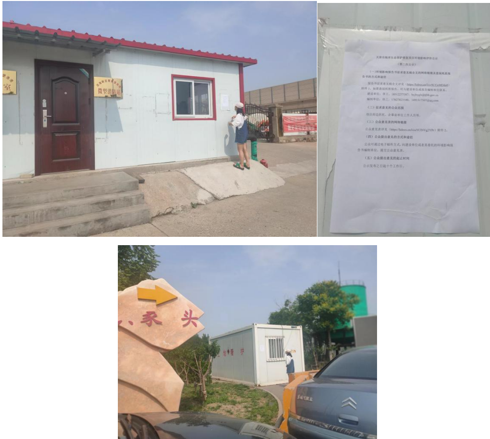
图 3.2-4 现场张贴图