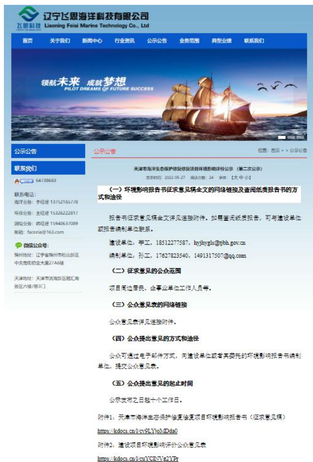
图 3.2-1 第二次公示内容截图