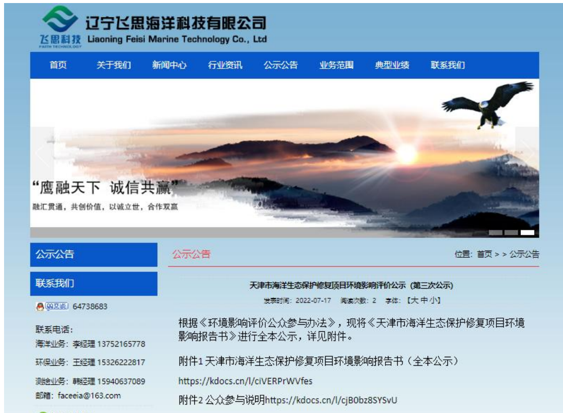
图 6.2-1 报批前信息公开截图

此次公开主要是通过辽宁飞思海洋科技有限公司网站的形式,链接网址为:www.fskj.net.cn/NewsDetail.aspx?ID=813,公示截图见下图所示。